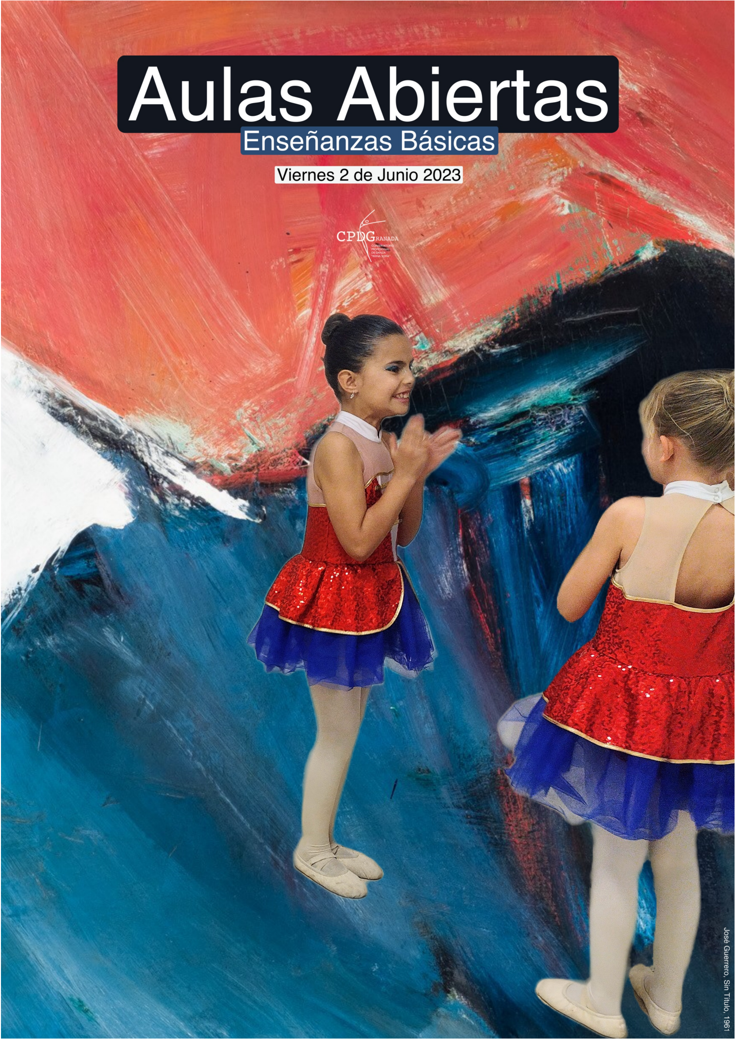
José Guerrero, Sin Título, 1961